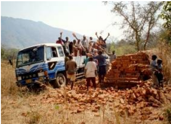
Schulen bauen mit „Chancen durch Bildung“

Mit der finanziellen Unterstützung von der Christian-Liebig-Stiftung e.V.; Sternstunden e.V., Children for a better world e.V. und weiteren Spendern konnten wir diese Projekte umsetzen.