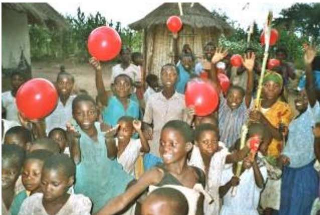
Kinder in Mpango (Region Dedza)

Ursprünglich war da nur die Idee eines Schülers nach einem Austausch mit Malawi bedürftigen Schülern einmalig zu helfen – mittlerweile sind wir als gemeinnützige Nicht-Regierungs-Organisation (NGO) anerkannt. Wir unterstützen Dorfgemeinschaften bei Neubau, Renovierung und Erhaltung von Schulgebäuden. Wir helfen Lehrlingen und Studenten mit Zuschüssen zu ihren Studiengebühren.