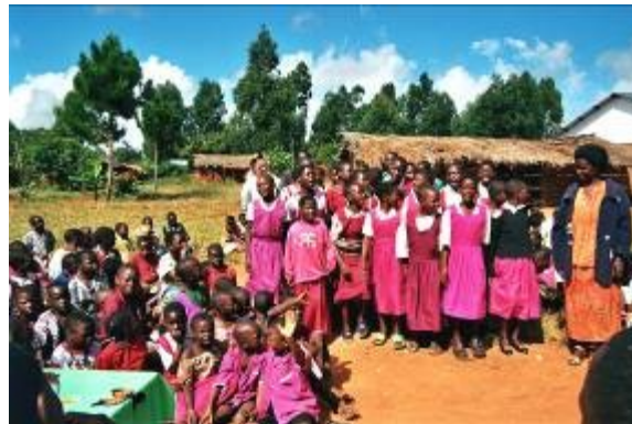
Eröffnung eines Schulblocks in Nambo