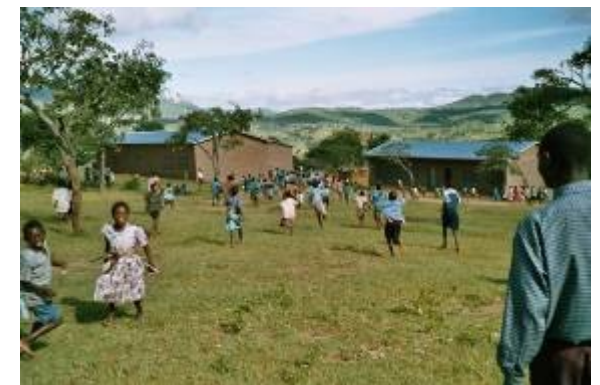
Primary School in Mpango (Region Dedza)

In Deutschland finden wir Spender, betreiben Vernetzung und Öffentlichkeitsarbeit, analysieren und organisieren Projekte in Malawi, die regelmäßig von aktiven Mitgliedern besucht werden. Dabei arbeiten wir mit unseren Ansprechpartnern vor Ort und anderen Organisationen zusammen, u.a. mit der GTZ und den Weißen Vätern in Malawi.