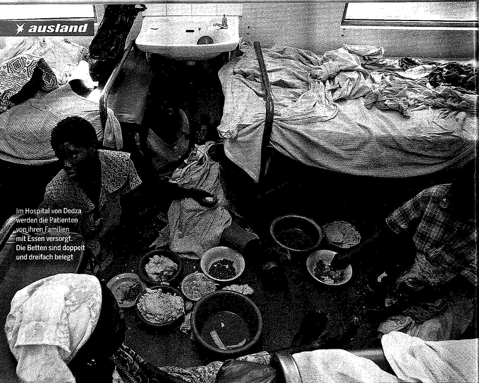
Im Hospital von Dedza werden die Patienten von ihren Familien mit Essen versorgt. Die Betten sind doppelt und dreifach belegt

kommen in den Genuss der Medikamente, die reiche Industriestaaten spenden? „Einhundertvierzehn“, sagt Madise.